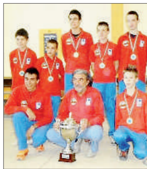
D.H. La baby Saluzzo campione d'Italia