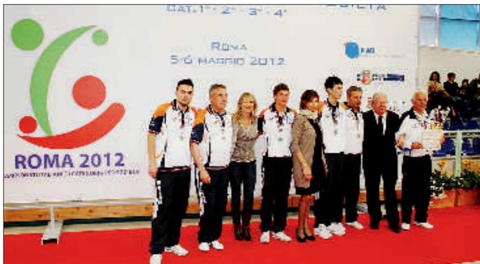
La Sant'Angelo Montegrillo di Perugia, squadra campione d'Italia di prima categoria

AL TERMINE di una lunghissima marcia di avvicinamento, che nell'arco di sei mesi ha progressivamente assottigliato uno schieramento iniziale composto da oltre 1200 società, sono state le migliori 32 ad approdare sulle 8 corsie del Centro tecnico federale di Roma per contendersi gli scudetti di 1a, 2a, 3a e 4a categoria della specialità raffa. E alla fine di due giornate entusiasmanti ad alzare le braccia al cielo in segno di vittoria sono state, nell'ordine, la Sant'Angelo Montegrillo di Perugia, la Città di Crotone, la Spello anche questa di Perugia e la Jesina di Ancona.