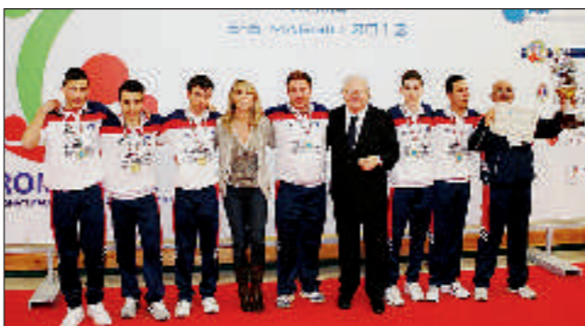
Il Crotona, campione di seconda categoria