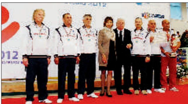
Lo Spello di Perugia, campione italiano di terza categoria

2ª CATEGORIA - 1º Città di Crotone, Crotona (tecnico