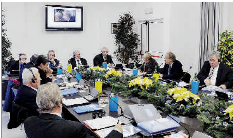
Il congresso della Federazione Internazionale al lavoro

SARÀ Portonovo, un paradiso della natura incastonato nella Riviera marchigiana del Conero, ad ospitare sabato 25 febbraio la prima edizione dell'Oscar Mondiale delle Bocce promosso dalla Confédération Mondiale des Sports de Boules, la Cmsb, presieduta dall'italiano Romolo Rizzoli. «L'Oscar Mondiale delle Bocce è un'iniziativa che ho ideato e voluto portare al traguardo confortato da tutto il direttivo della Confederazione mondiale. Questo premio - ha sottolineato con ambizione il presidente della Cmsb Rizzoli alla presentazione dell'evento - rappresenta una forte segnale unitario ed esalta la sinergia tra le diverse famiglie di questo sport che operano in tutti i continenti. Arriveranno in Italia da ogni angolo del mondo, nello stupendo scenario rappresentato da Portonovo, la perla dell'Adriatico, i massimi dirigenti ed i grandi campioni dello sport delle bocce di tutte le specialità per festeggiare la nascita di questo 1° Oscar Mondiale, una passerella di fuoriclasse che hanno dato spettacolo con le loro imprese sotto i cieli di tutto il mondo. Voglio infatti ricordare che oggi - ha continuato il presidente - si gioca a bocce in 116 paesi, un segnale di grande vitalità e diffusione che, nell'ottica di una politica unitaria delle quattro specialità, ci fa apprezzare e ci fa onore».