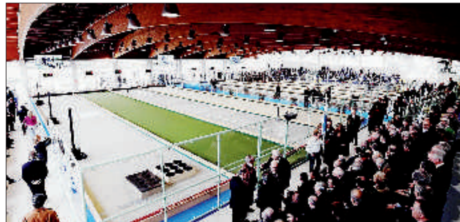
I campi del CTF della Capitale dove si giocheranno i campionati italiani della raffa

AL culmine di una stagione a passo di carica, che ha già assegnato lo scudetto di serie A, la Coppa Italia jr e 16 titoli nazionali di specialità, l'attenzione di chi segue le vicende della raffa è ora rivolta verso il Centro Tecnico Federale di Roma, dove da domani pomeriggio 32 atleti e 12 atlete si contenderanno le due casacche tricolori più ambite: quelle di categoria A1. Per avere l'esatta misura di che cosa si sta profilando all'orizzonte sulle 8 corsie sintetiche capitoline basta dare una scorsa alle cifre da capogiro espresse da questo grande evento.